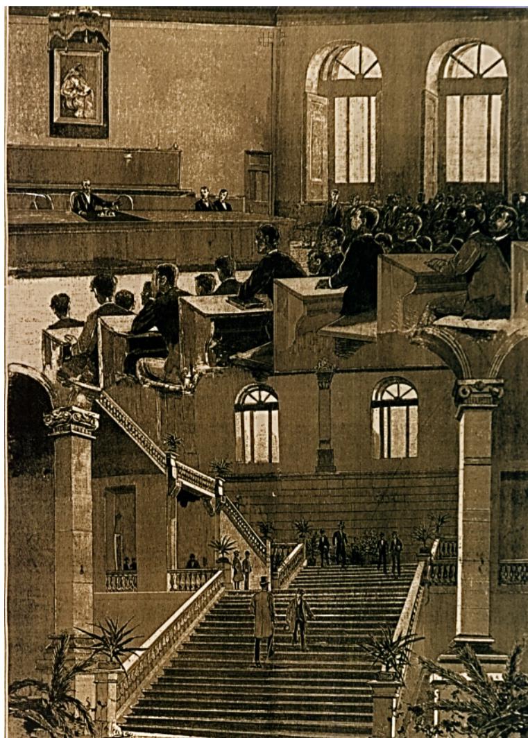
Figura IV.1. Dibujo por Manuel Alcázar del interior y una aula del Instituto Cardenal Cisneros. 1888.

Aunque ya no es posible rescatar ni devolver la voz, el gesto y la acción cotidiana de los catedráticos de Historia de entresiglos, las imágenes del interior de las aulas y el estudio hecho de los textos visibles, nos bastan para reconstruir las coordenadas espacio temporales que aprisionaban, con más fuerza que las categorías kantianas, las prácticas de profesores y alumnos.