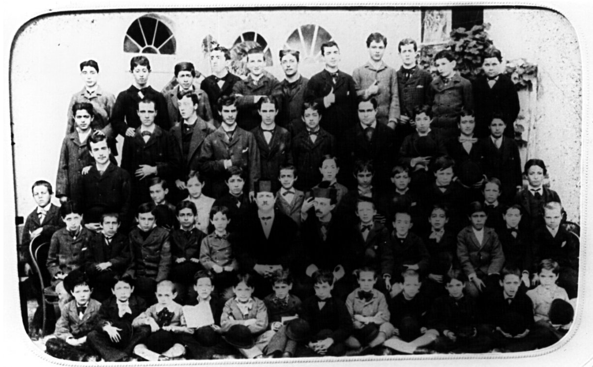
Fig. IV.2. Profesores y alumnos del Instituto de Segunda Enseñanza de Cádiz. 1880-1881.

Las imágenes del pasado, gracias a la cada vez más frecuente utilización de la fotografía, nos permiten recobrar los usos de una tradición, que se expresa en los atavíos y las maneras.